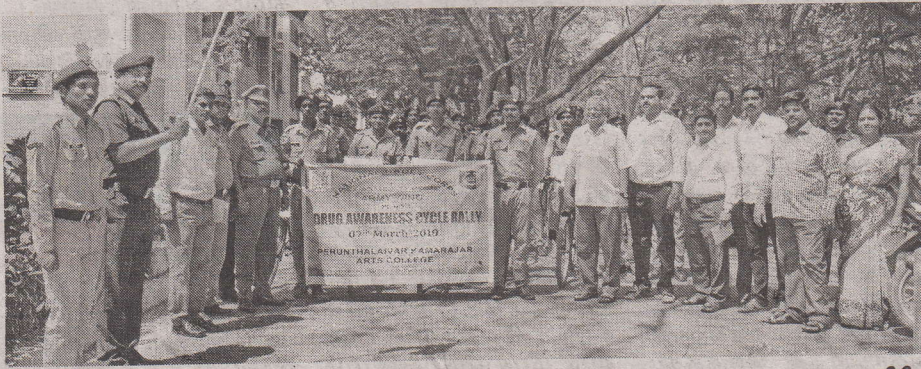
கலிதீர்த்தாள் குப்பம் பெருந்தலைவர் காமராஜர் கல்லூரி மாணவர் தரைப்படை பிரிவு சார்பில் போதை விழிப்புணர்வு சைக்கிள் பேரணி நடைபெற்றது.